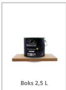
Boks 2,5 L